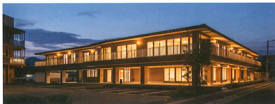
特別養護老人ホーム まほろば