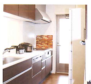
家庭的な雰囲気のリビング