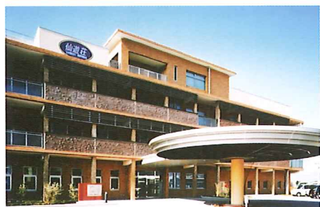
特別養護老人ホーム 仙遊荘

社会福祉法人善通寺福祉会は、地域に根ざした視点で、利用者様が安心して楽しいひと時を送れるよう努めることを信条としております。利用者様の声に耳を傾けるだけでなく、ご家族のみならずとも連携を取り、お一人おひとりに合ったサービスをご提供いたします。介護に関するご相談、その他ご質問など受け付けております。いつでもお気軽にお問い合わせください。