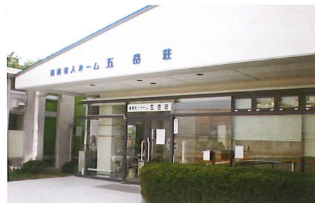
養護老人ホーム 五岳荘